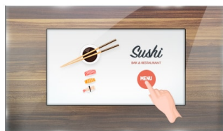
Тач через стекло

The ProLite TF1015MC (10.1 inch) uses PCAP touch technology and is built into an eye catching bezel with edge-to-edge glass. Thanks to a glass overlay covering the screen and a rugged bezel, it guarantees high durability and scratch-resistance, making it perfect for kiosk and high use public facing applications. Equipped with a foam seal finish it supports seamless integration into kiosks and provides IP65 rating resulting in dust and water resistance from the front. Landscape, portrait and face-up orientation ensures flexible mounting possibilities in almost any installation. For ease of integration, the TF1015MC comes equipped with external mounting brackets making it an ideal solution for kiosk integrators, industrial environments, control rooms and interactive multimedia.